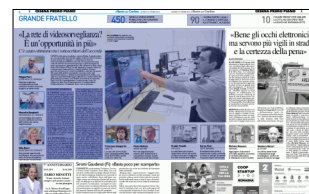
Peso: 1-14%, 38-53%