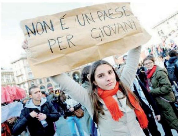
Una ragazza protesta parafrasando il titolo del film dei fratelli Coen

Per il segretario Cisl «vanno adeguati i premi di produttività per i lavoratori all'andamento positivo delle imprese»