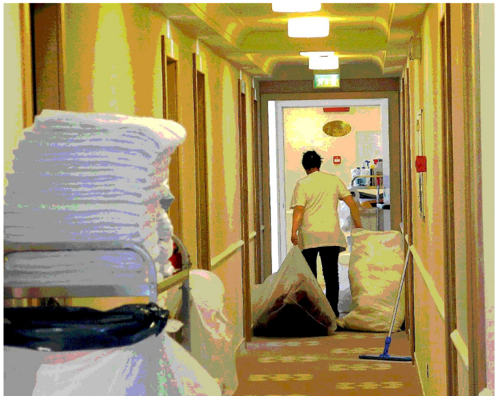
Una addetta al piano di un hotel IMMAGINE DI REPERTORIO

«Questi sono segnali di un turismo che cerca solo la concorrenza sul basso prezzo a scapito della qualità»