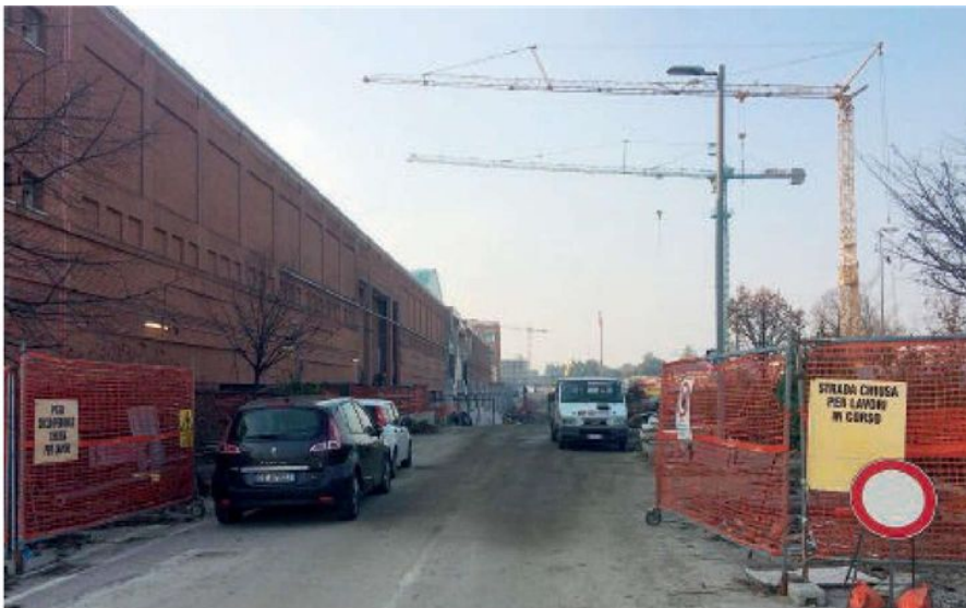
Il cantiere ed il reparto di Chirurgia Maxillofacciale

Soccorso nel cantiere e ricoverato al Bufalini: caduta da 4 metri