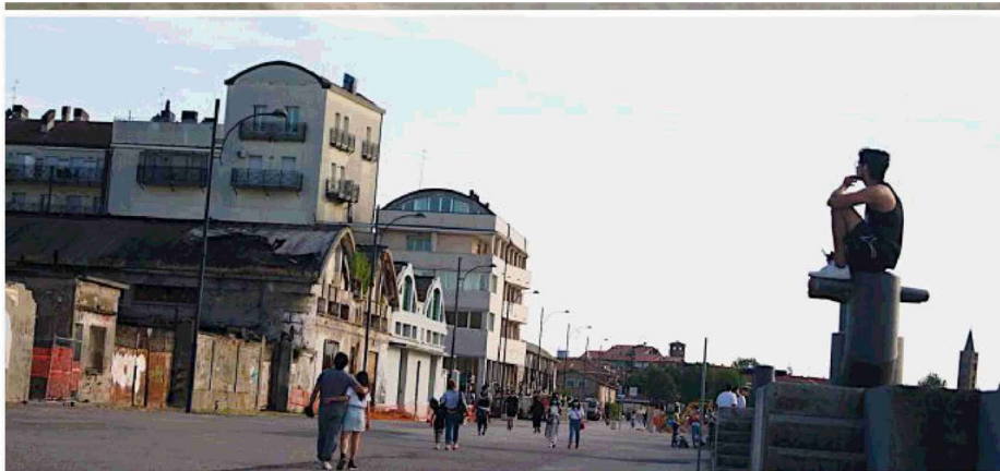
Ancora pochi i locali aperti sul litorale, così i giovani affollano la Darsena, con i sui locali affacciati sul Candiano o anche solo per una passeggiata

lo svolgimento del salvataggio nella massima tutela della salute dei lavoratori, considerando la delicatezza del soccorso in mare. Garantire un servizio eccellente, sia per quanto riguarda l'applicazione delle linee guida regionali per la messa in sicurezza degli stabilimenti balneari sia per quanto attiene il servizio di salvataggio, sarà elemento importante per attrarre i turisti nelle nostre località e rilanciare le nostre spiagge».